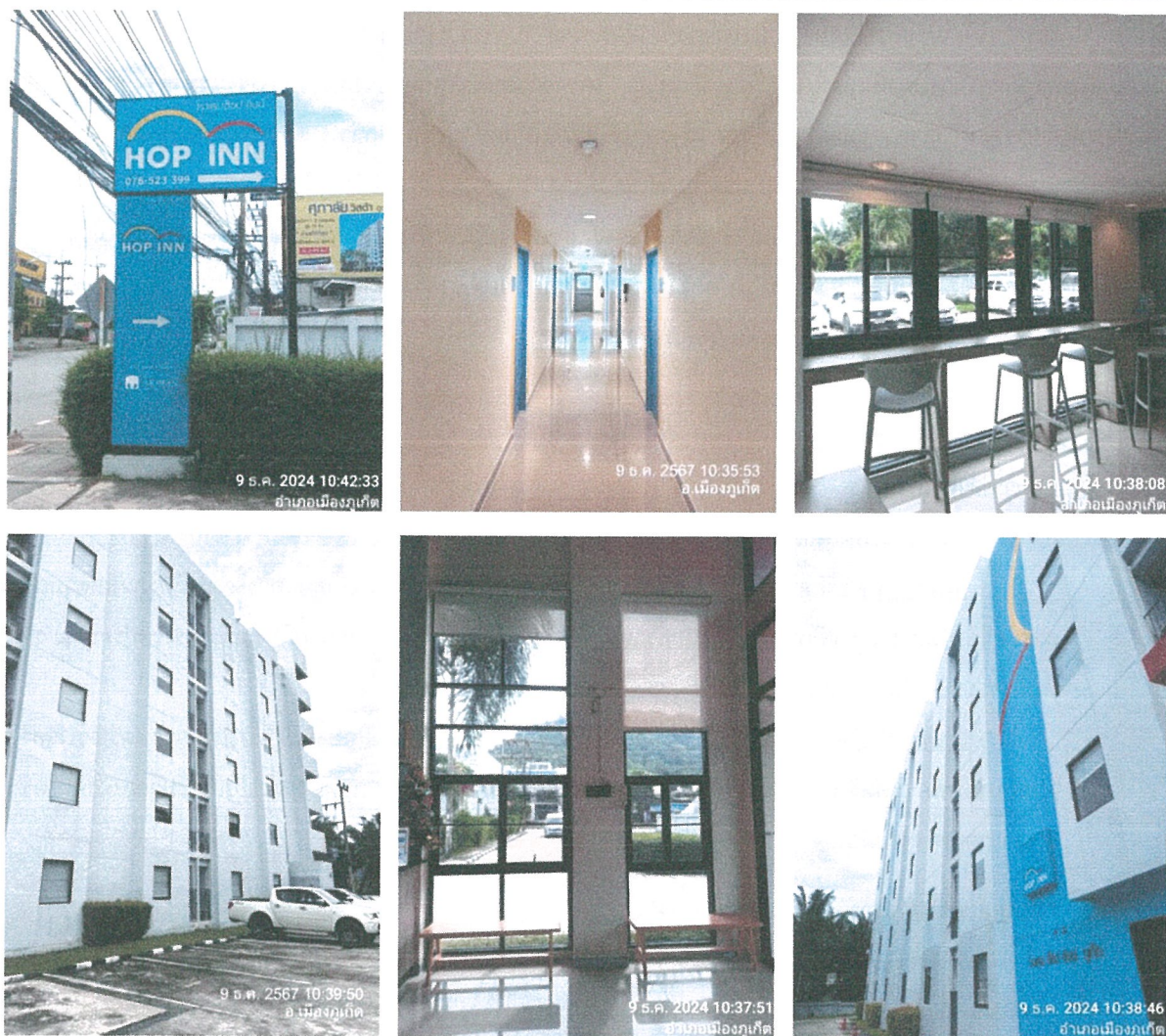
รูปภาพที่ 1.4 การใช้พื้นที่ของโครงการ