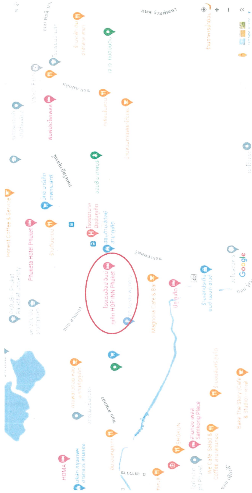
รูปภาพที่ 1.2 แผนที่ตั้งของโครงการ โรงแรม ฮีป อินน์ ภูเก็ต